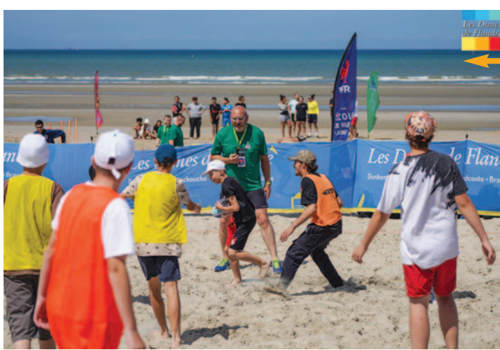
BEACH RUGBY Tournoi de beach rugby le 26 juillet, lors de La Tournée des Plages des Dunes de Flandre