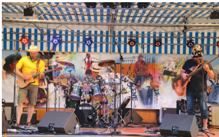
WEEK-END EN SCÈNE Les 9 et 10 juin, un week-end en concerts de tous styles, organisé par Zuydcoote Animations !