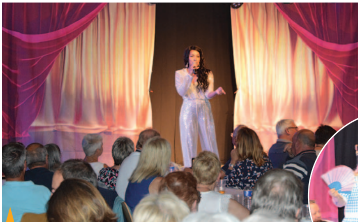
CABARET Le 21 juillet, le spectacle transformiste, organisé par Zuydcoote Animations, a fait rire les spectateurs.