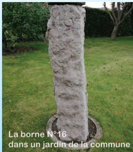
La borne N°16 dans un jardin de la commune

En vous promenant sur la plage, en face de l'Hôpital Maritime, peut-être avez-vous vu une pierre, avec le numéro 17. C'est une borne qui a été posée par les Ponts et Chaussées et qui représente la limite de la division des dunes.