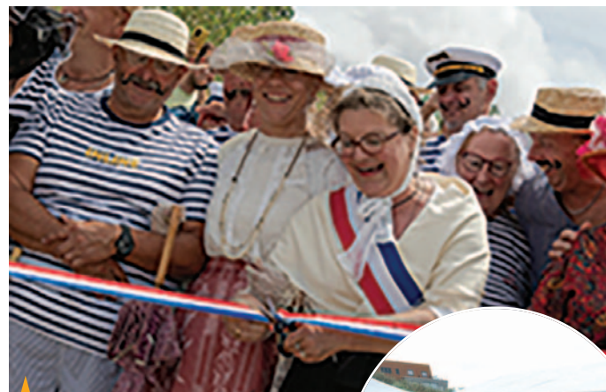
ZUYD'CÔTE À L'ANCIENNE Le 16 juillet, Zuyd'Côte à l'ancienne avec le retour à « La Belle Epoque et ses bains de mer » a remporté, de nouveau, un succès, organisé par Zuydcoote Animations.