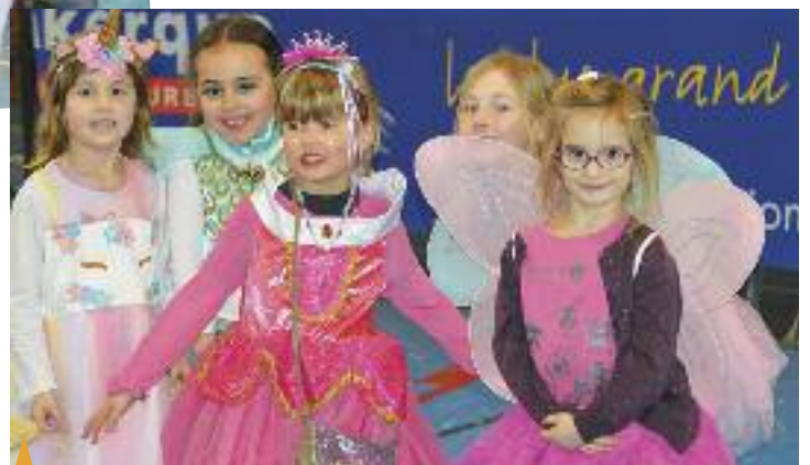
CARNAVAL ENFANTIN DE ZUYDCOOTE le mercredi 5 février