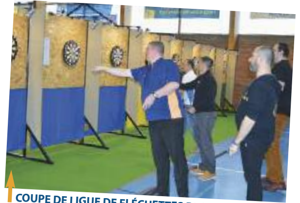
COUPE DE LIGUE DE FLÉCHETTES DES VOGELPIK, samedi 1 er février