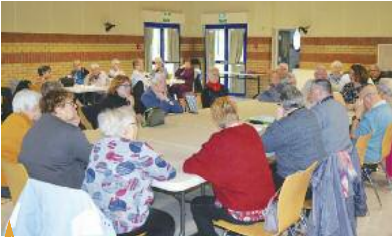
ASSEMBLÉE GÉNÉRALE DU CLUB DES TOUJOURS JEUNES, lundi 20 janvier