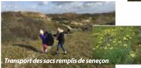
Transport des sacs remplis de seneçon