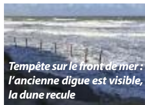
Tempête sur le front de mer : l'ancienne digue est visible, la dune recule