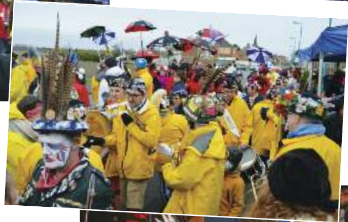
CHAPELLE ET BANDE DE CARNAVAL DE ZUYDCOOTE Organisée par l'association Zuydcoote Animations, le samedi 8 février