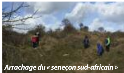
Arrachage du « seneçon sud-africain »