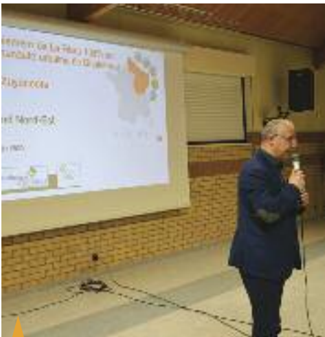
RÉUNION PUBLIQUE D'INFORMATION SUR LA FIBRE OPTIQUE, mardi 11 février