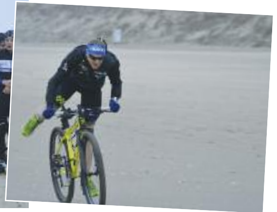
↑ RUN & BIKE , dimanche 27 janvier organisé par Cap sur la Forme.