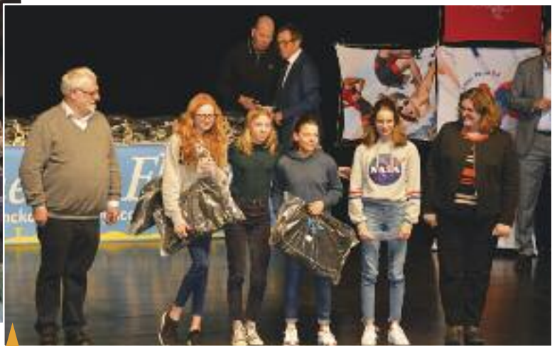
↑ 26 ÈME CHALLENGE DES DUNES DE FLANDRE , mardi 22 janvier, organisé par la Mairie de Zuydcoote en partenariat avec la mairie de Bray-Dunes. Les récompenses ont été remises à la salle Dany Boon.