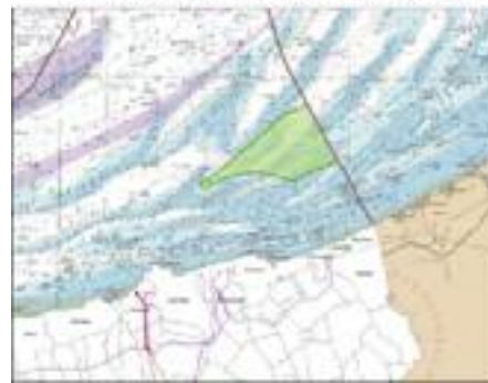
Perimètre final en novembre 2018