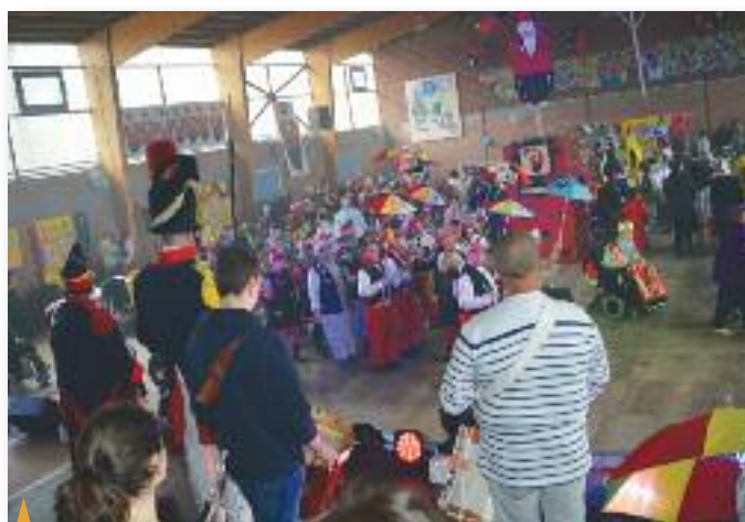
↑ CARNAVAL DE L'INSTITUT D'ÉDUCATION MOTRICE le mercredi 8 février 2017.