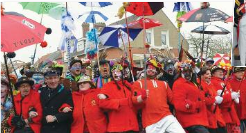
↑ BANDE DE CARNAVAL organisée par Zuydcoote Animations, le samedi 11 février 2017.