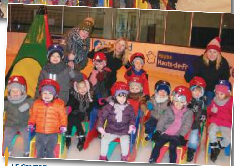
LE CENTRE DE LOISIRS MATERNEL A LA PATINOIRE !!!