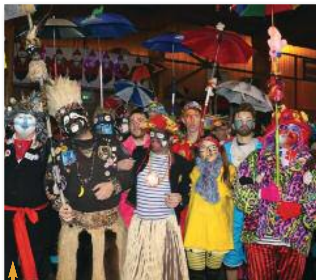
↑ BAL DE CARNAVAL organisé par les Judcoot'Lussen, le samedi 11 février 2017.