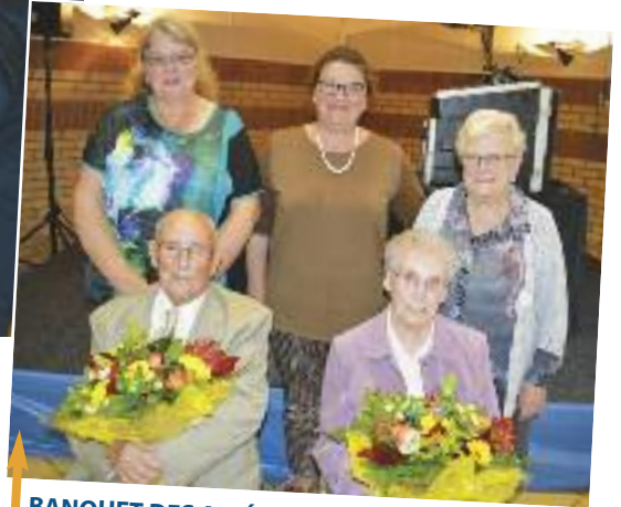
BANQUET DES AINÉS Offert par la Municipalité le dimanche 15 octobre.