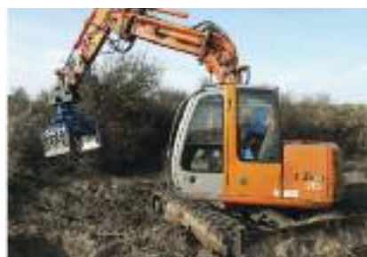
Débroussaillage mécanique : enlèvement et exportation des arbustes à la mini-pelle mécanique

Pour votre information, la dune reste ouverte au public pendant cette période hormis les zones de travaux.