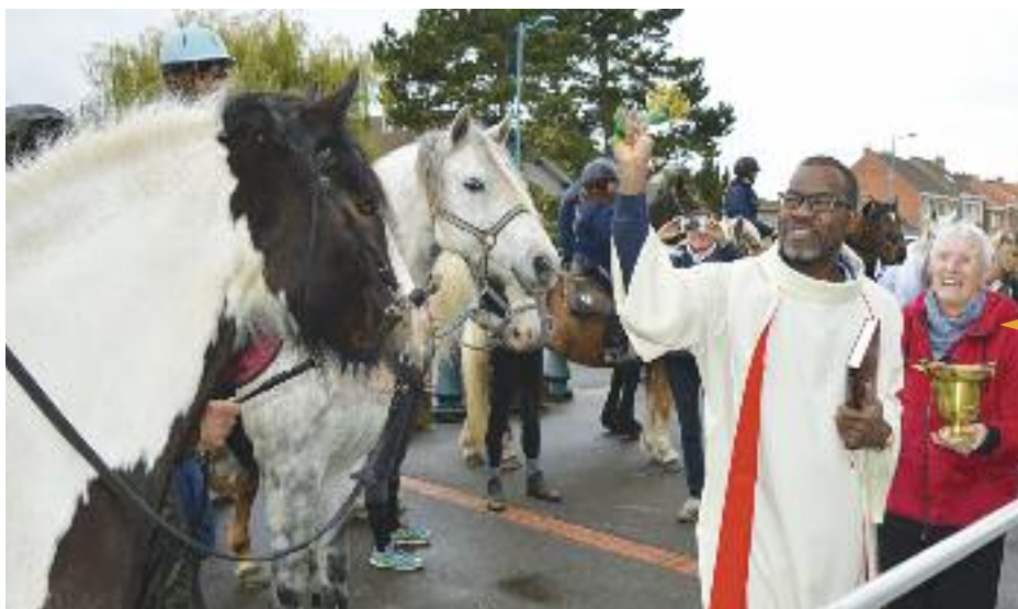
← FÊTE DE LA ST HUBERT

Organisée par l'association ACMF le samedi 7 octobre. Bénédiction des chevaux en fin d'après-midi devant l'église St Nicolas de Zuydcoote.