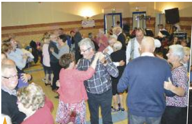
↑ THÉ DANSANT

Organisé par l'association Mzic Band, le dimanche 22 octobre.