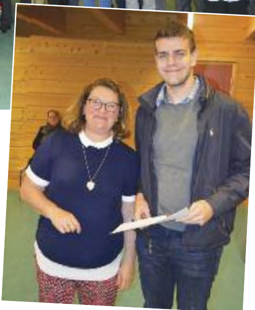
RÉCOMPENSES DON DU SANG le vendredi 20 octobre.