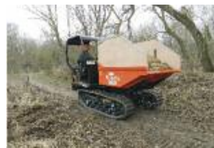
Exportation des copeaux – petit dumper à chenille

Ces travaux font l'objet du soutien financier de l'Union Européenne dans le cadre du projet transfrontalier « LIFE+ Nature FLANDRE » de préservation des milieux dunaires entre Dunkerque et Westend (Belgique) et ont été présentés en réunion publique à Zuydcoote l'automne dernier.