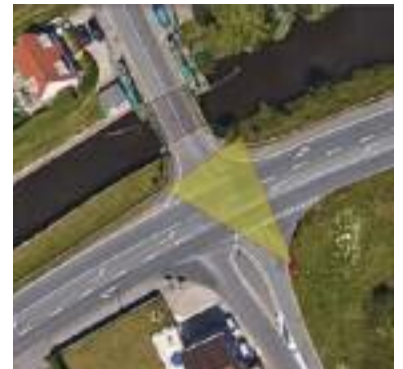
Carrefour rue du Général de Gaulle Route de Furnes (D601)