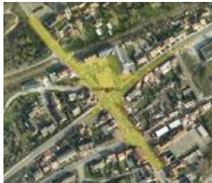
Carrefour Place de la Gare Rue la Résistance