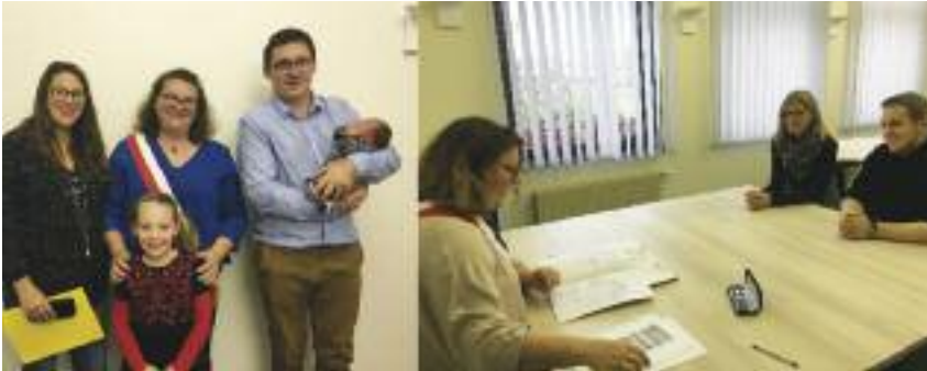
DE RYCKER – BLONDEEL

La loi de modernisation de la justice du 18 novembre 2016 confie aux communes la gestion des pactes civils de solidarité (Pacs).