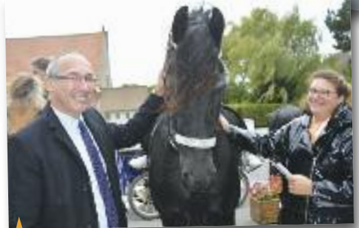
↑ FÊTE DE LA SAINT HUBERT , Organisée par l'association « ACMF », le samedi 6 octobre.