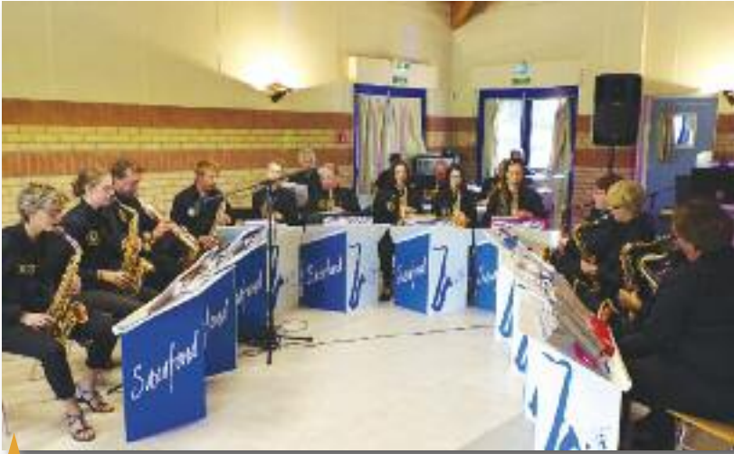
↑ THÉ DANSANT , Organisé par l'association « MZIC BAND », le dimanche 21 octobre.