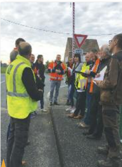
↑ RÉUNION DE CHANTIER POUR LE CARREFOUR À FEUX , le lundi 15 octobre.